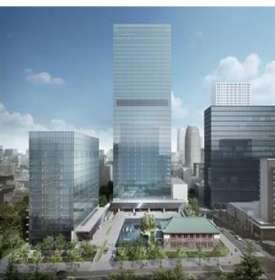
新装後のホテル全景