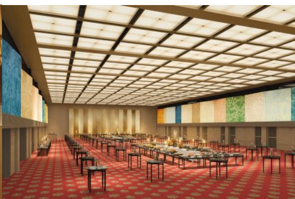
プレステージタワー1階「平安の間」

お申し込みお問い合わせは、 info@ifcf.or.jp までメールをお送りください。 一般社団法人 日本食文化会議 〒102-0082 東京都千代田区一番町19番地「Good Food Japan株式会社」内